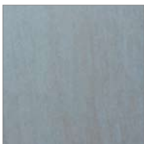
Raw Travertin Flise 300 X 300 mm

Gulvbelægning i entré/bryggers og badeværelser er flotte klinker i serien RAW TRAVERTIN eller V&B SPECTRUM ANTRACIT.