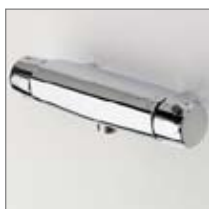
Oras Nova (7461) Bruserarmatur