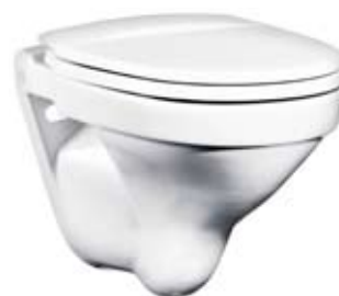
WC Nordic 2330 Vægophængt toilet