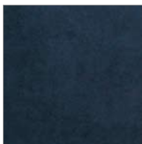
V&B Spectrum Antracit 296 X 296 mm