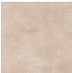
Vinyl Tarkett Extra Kiruma Beige