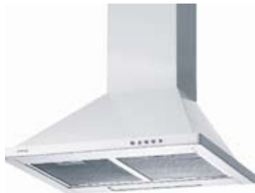
Gorenje Emhætte DK600W Hvid