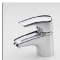
Oras Saga (1910) Håndvaskarmatur