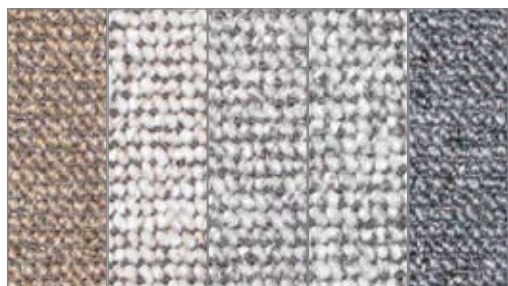
Gulvtæppe cantane combo EN1307 Class 22+