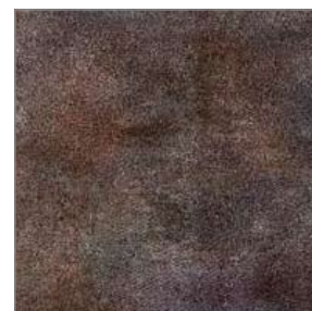
Vinyl Tarkett Extra Kiruma Anthracite