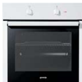
Gorenje indbygningsovn BO7110AW Hvid