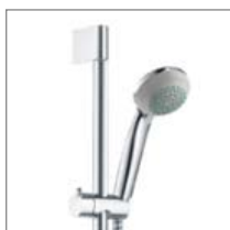
Crometta 85 Håndbrusersæt