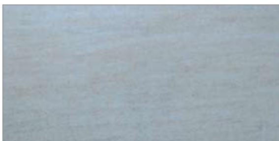
Raw Travertin Flise 300 X 600 mm