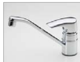
Oras Saga (1930) Køkken- og bryggersarmatur