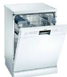
Siemens opvaskemaskine SN 26N230 Hvid