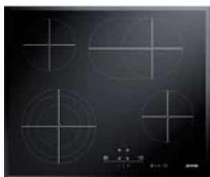
Gorenje glaskeramisk kogeplade ECS680AX rustfrit kant